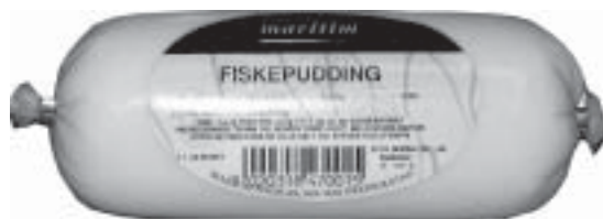
Fiskepudding fra vår gode nabo, Rema

Ingredienser som står på pakken fra butikken er: skinn og benfri fiskefilet, melk, stivelse, vegetabilsk olje, salt og krydder. Det er enkelt nok å lage fiskepudding hjemme. Du trenger bare en stor maskin for å lage fiskedeig. Da bør du blande fiskedeigen med melk, hvetemel, olje, salt og krydder. Til slutt bør du lage en røre av blandingen og pakke den inn i plast, så den ligner en stor fiskepølse.