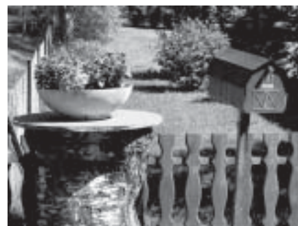
Inngangsparti med vårlige blomster.