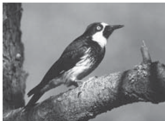
Første tegn på våren er blomster - og - fugler.