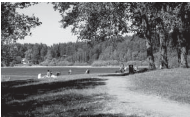
En fin, vårlig ettermiddag ved Midtsjøvannet i Ski.