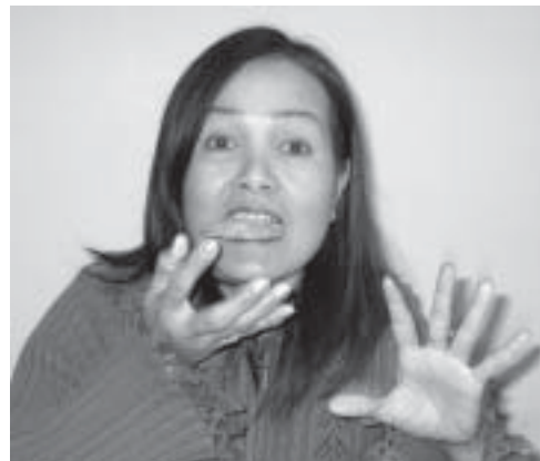
Pimnara gir Bostonakene fem stjerner

4 spiseskjeer smør ¼ teskje salt 100 g sukker ½ teskje kanel 1 egg, vispet 1 dl hakkete nøtter 140 g hvetemel 1 dl rosiner ¼ teskje bakepulver