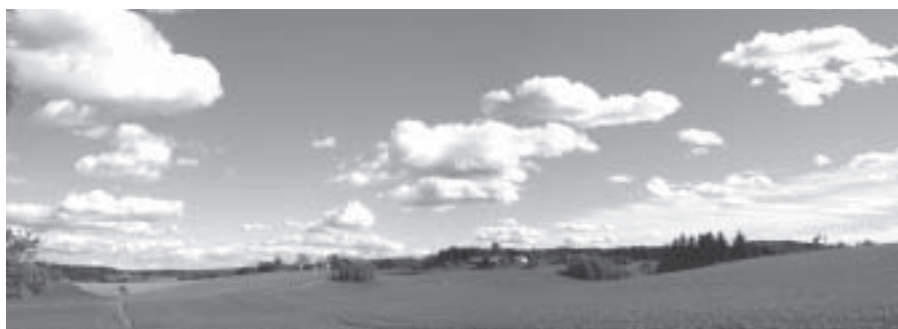
Vårlig himmel i Kråkstad.

I mitt land, Irak, er våren kjempebra, også. Der er mye fint vær og flere forskjellige blomster og frukttrær. I begge land, synger fuglene i hagen. Hvilken vår liker du best? Den norske eller den i hjemlandet ditt?