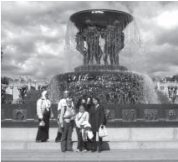
Klassen poserer foran fontenen.